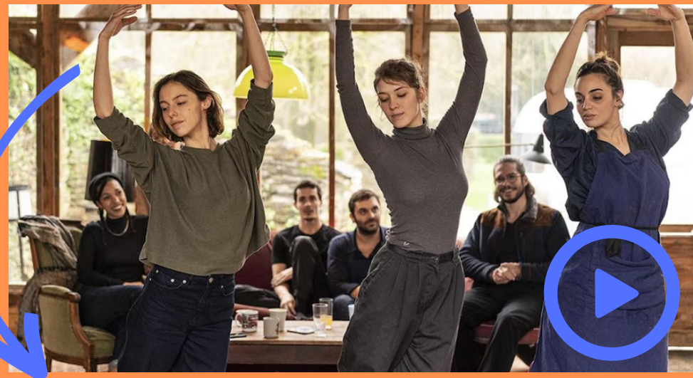
En corps de Cédric Klapisch (2022) Film (long métrage) mettant en vedette l'univers du chorégraphe et interprète Hofesh Shechter