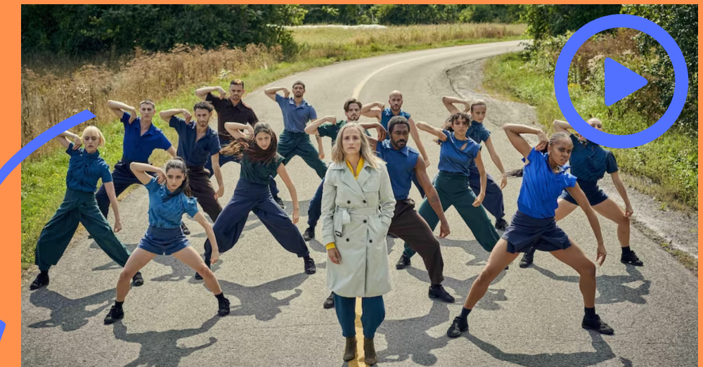
Mélodies perdues de Christian Lalumière (2021) Vidéodanse (moyen métrage) mettant en scène les interprètes de la compagnie Ballets Jazz de Montréal