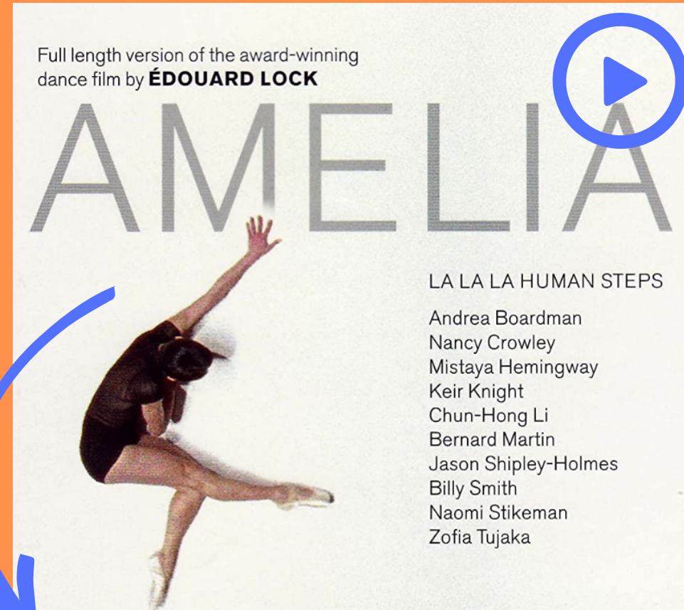
Amelia d'Édouard Lock (2003) Vidéodanse (moyen métrage) mettant en scène les interprètes de la compagnie La la la Human Steps